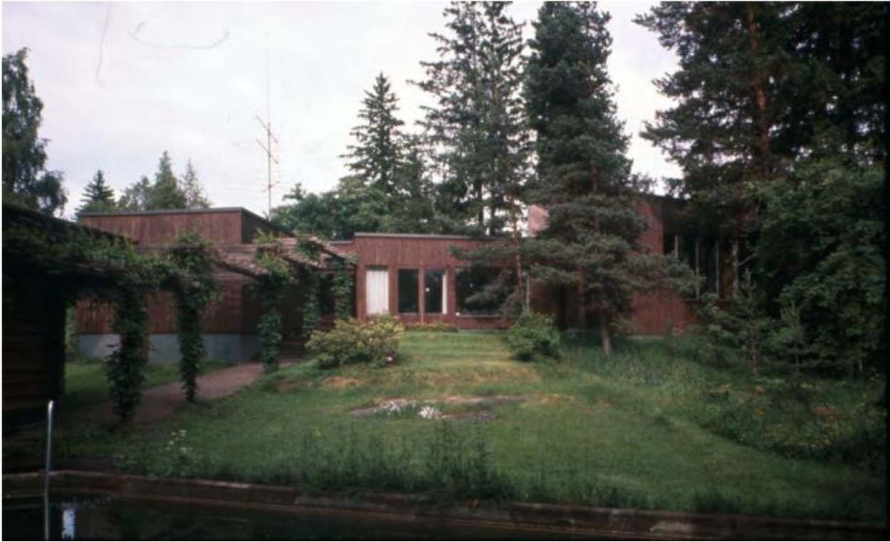
Näkymä altaalta päin vuonna 1970