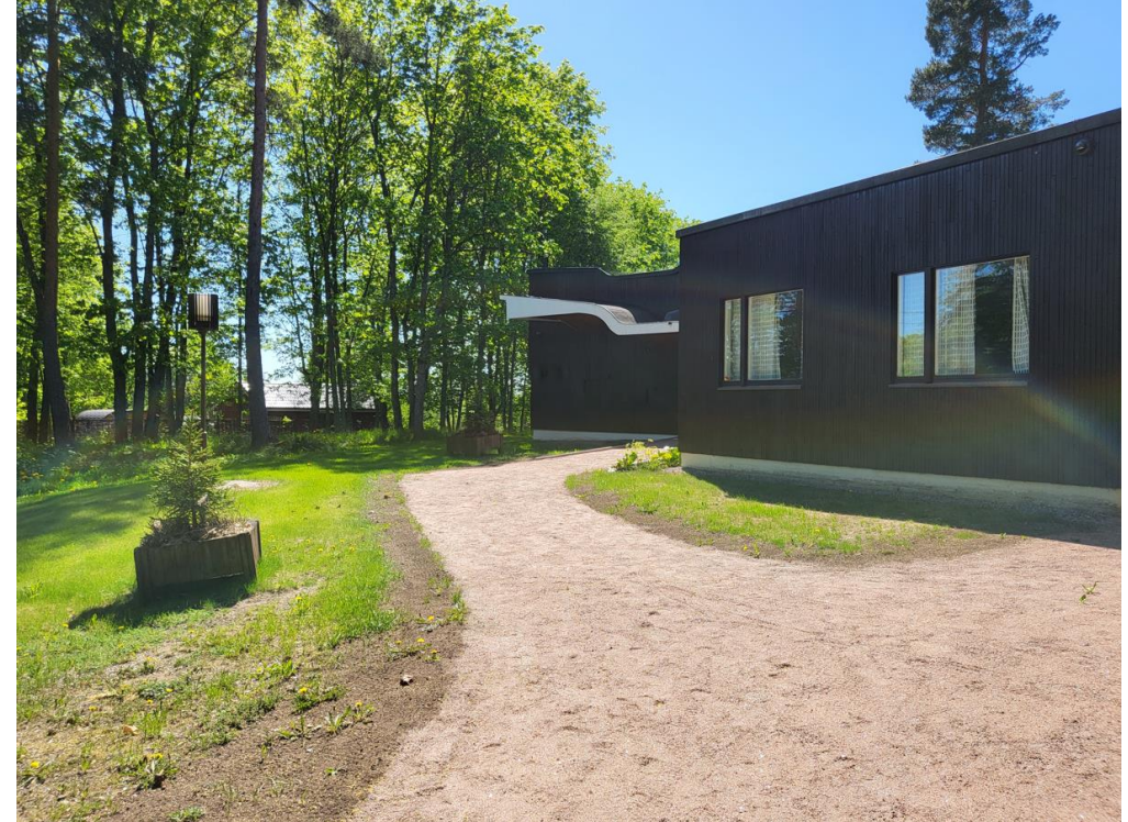
Sisäänkäynti vuonna 2024