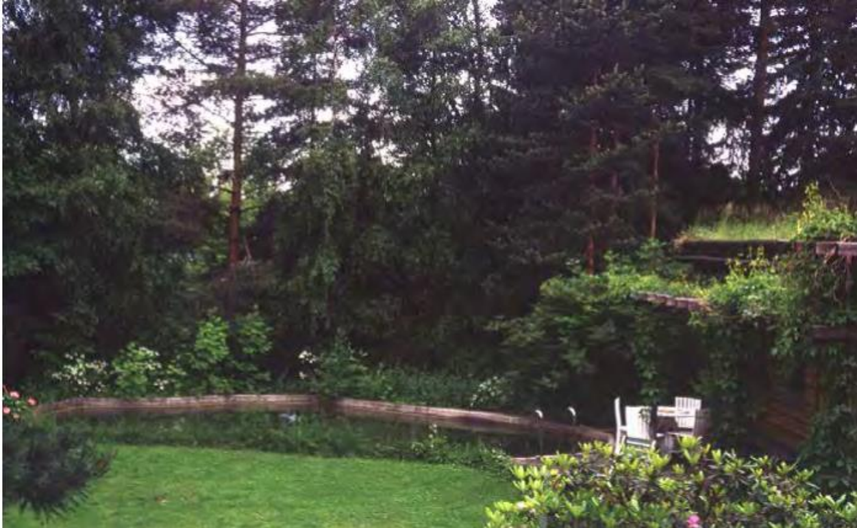
Ummessa oleva järvinäkymä vuonna 1977