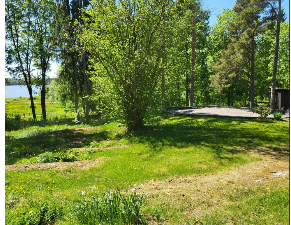
Järvinäkymä vuonna 2024