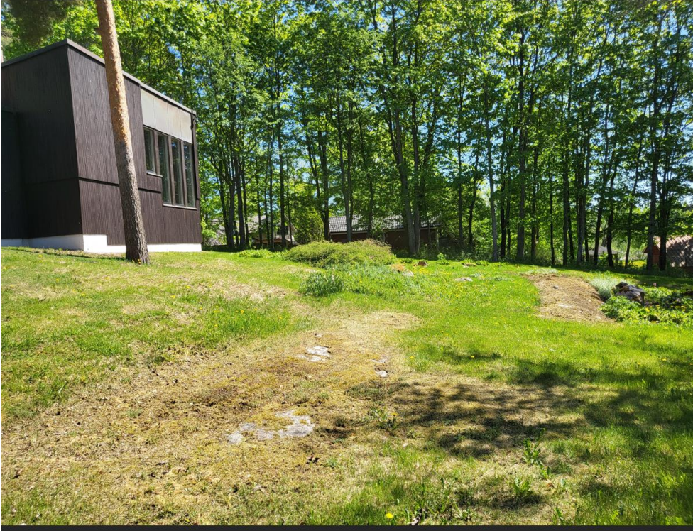
Takapihan nurmialuetta vuonna 2024