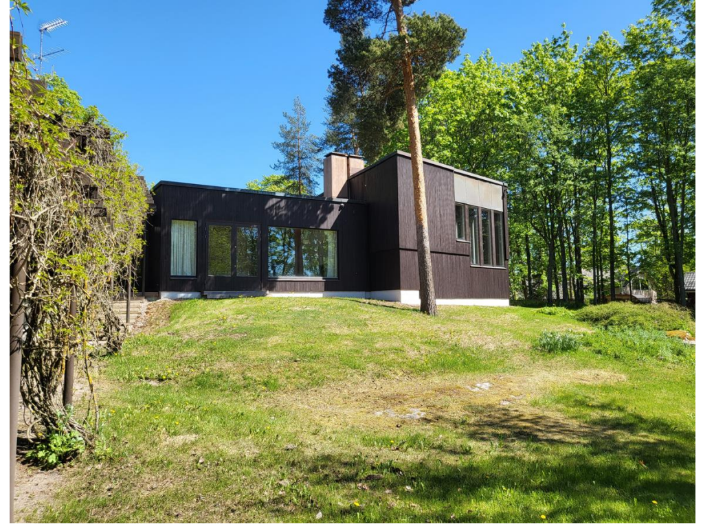
Näkymä altaalta päin vuonna 2024